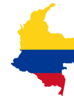
Miembros de la fuerza pública que hayan sido procesados o hayan cometido delitos relacionados con el conflicto armado