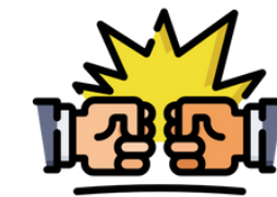
Terceros responsables civiles que hayan sido procesados o cometido delitos relacionados con el conflicto