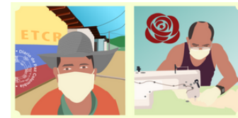
Ex combatientes FARC EP